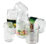
POTS ET BOCAUX EN VERRE