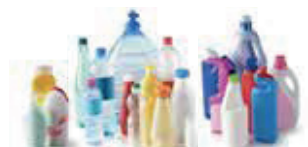
BOUTEILLES ET FLAcons PLASTIQUES